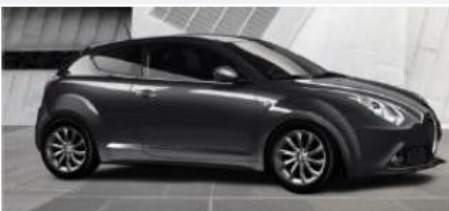
58B SZARY - ARDESIA GREY (METALIZOWANY)