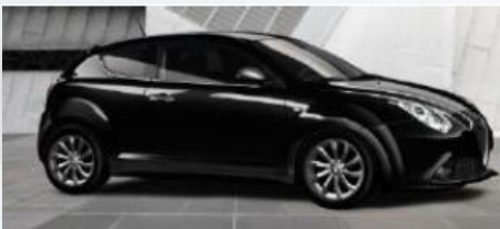
601 CZARNY - ALFA BLACK (PASTELOWY)