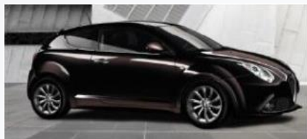
805 CZARNY - ETNA BLACK (METALIZOWANY)