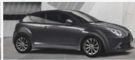
529 SZARY - MATT GREY (MATOWY)