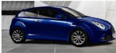
468 NIEBIESKI - TORNADO BLUE (METALIZOWANY)