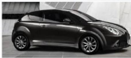
607 SZARY - ANTRACITE GREY (METALIZOWANY)