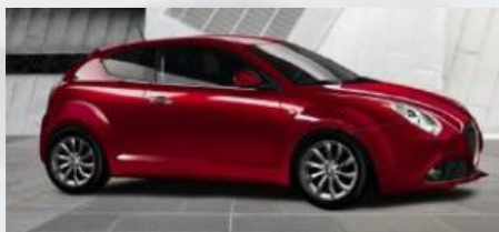
289 CZERWONY - ALFA RED (PASTELOWY)