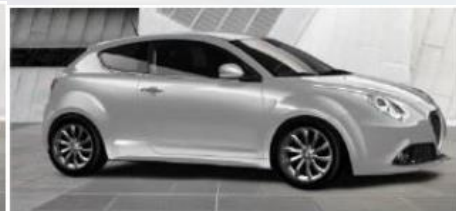
612 SREBNY - TECHNO GREY (METALIZOWANY)