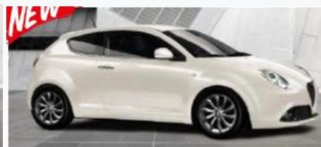
268 BIAŁY - ALFA WHITE (PASTELOWY)