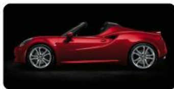
LAKIER TRÓJWARSTWOWY OPCJA 5JQ