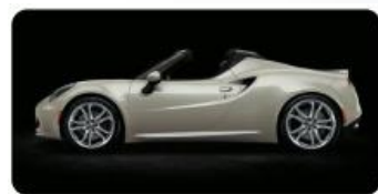
LAKIER TRÓJWARSTWOWY OPCJA 6FW