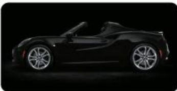
LAKIER PASTELOWY OPCJA 5CB