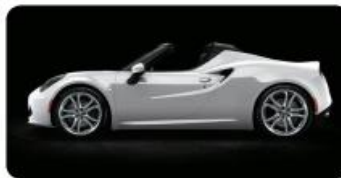
LAKIER PASTELOWY OPCJA 5CA