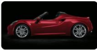
LAKIER PASTELOWY OPCJA 74F