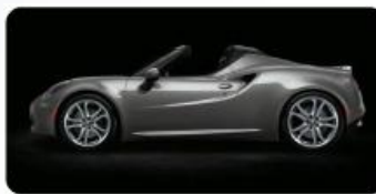
LAKIER METALIZOWANY OPCJA 210