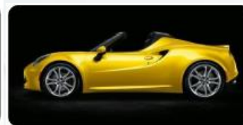
LAKIER PASTELOWY OPCJA 4H5